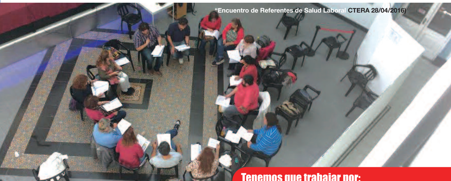
“Encuentro de Referentes de Salud Laboral CTERA 28/04/2016)

de trabajo que las generan y el incumplimiento por parte de ellos mismos con las normas legales vigentes.”